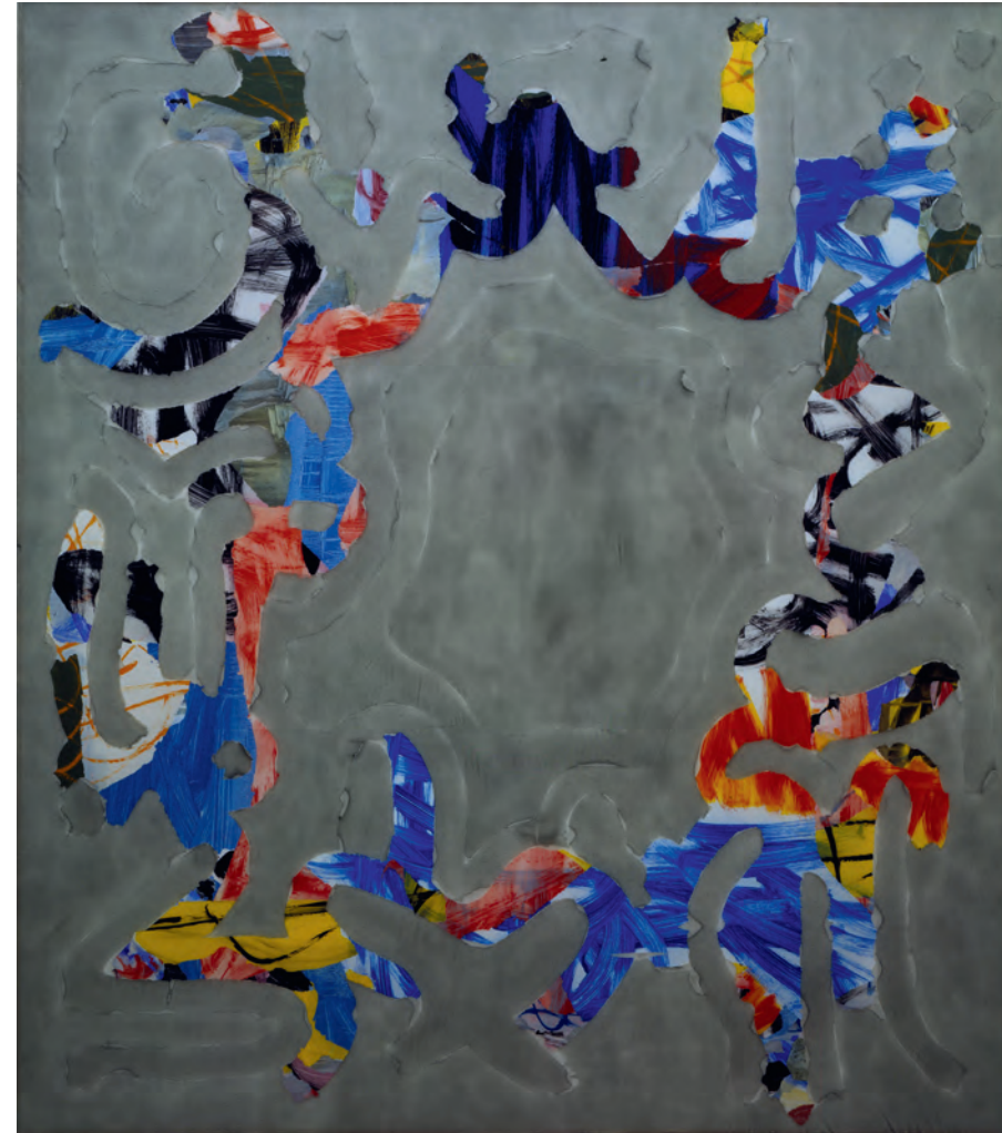
Eureka V , 1999, acrylique sur toile, 180 x 160 cm