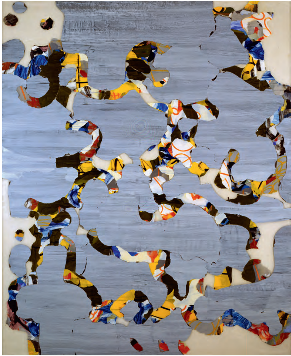
Eureka V , 1999, acrylique sur toile, 200 x 180 cm