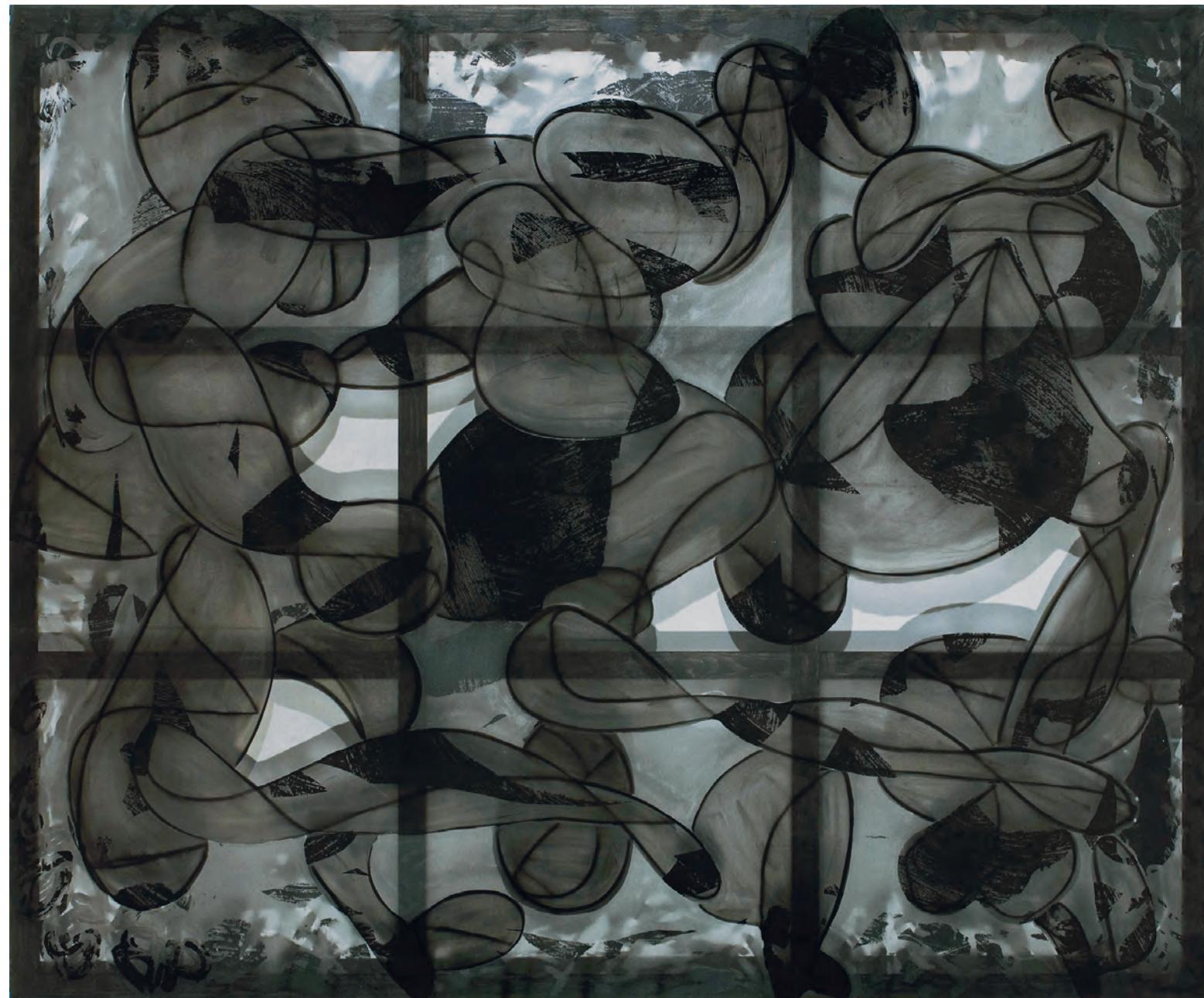
Eureka IX , 2009-2010, acrylique sur toile de nylon, 250 x 300 cm Au recto : Eureka VIII , 2010, acrylique sur toile de nylon, 250 x 200 cm

1, rue d'Alger - 75001 Paris. Tél. +33 (0)1 40 20 98 07 Du mardi au samedi de 10h30 à 12h30 et de 14h à 18h30 email : galeriejacqueselbaz@wanadoo.fr Site : www.galeriejacqueselbaz.com